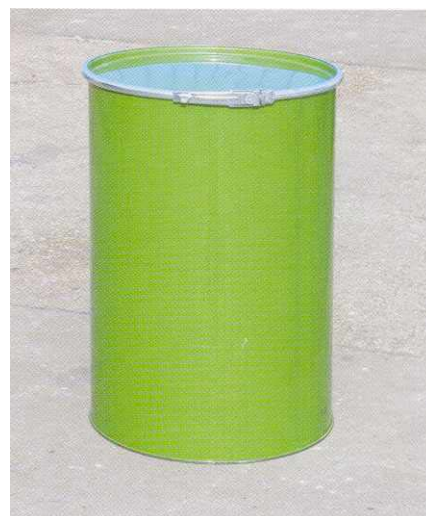
Beczka z pokrywą 216,5 l / 200 kg

stożkowy blacha ocynkowana 328 x 312 x 390 mm