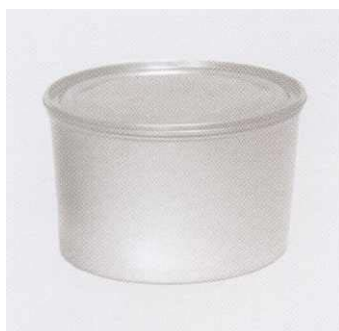
Puszka pakowana próżniowo 2,5 kg

W tej Informacji Technicznej chcemy przedstawić naszym Klientom opakowania, w jakich mogą być dostarczane farby do druku gazetowego.