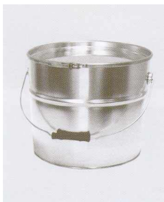
Hobok 10 kg

z uchwytem stożkowy blacha ocynkowana 280 x 265 x 235