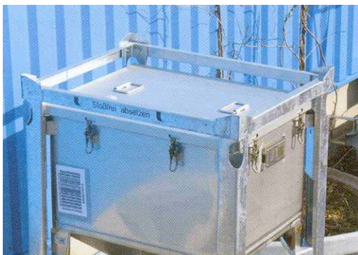
Wersja HST Zawór kulkowy 3"